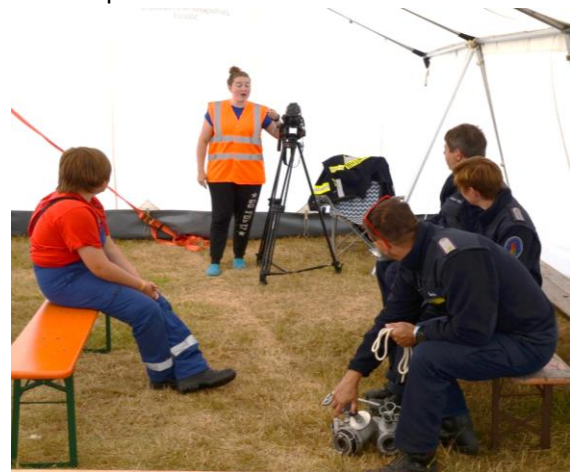
Der zweite Teil Theorie: hier Fragen ob man „im Film“ ist