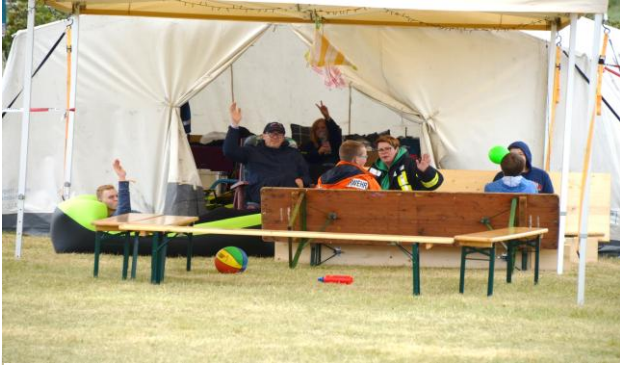
Eine fröhliche Runde auf der Insel Mando: „Hallo Presse“. „Hallo, Teletubbies“. Wer kennt sie nicht: Tinky-Winky, Dipsy, Laa-Laa und Po.