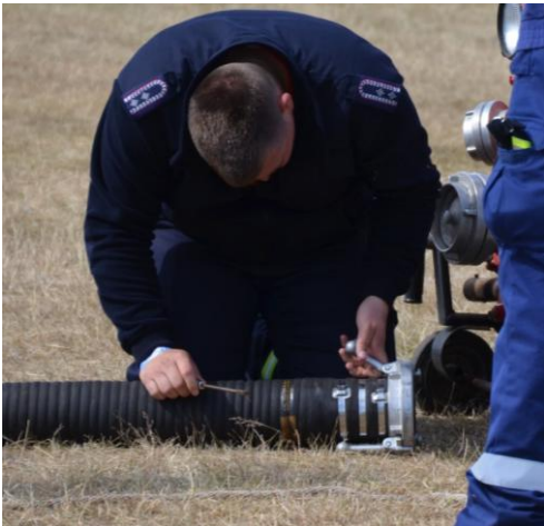
Erste Vorbereitungen. Immer muss nachjustiert werden.

Hier ein paar Impressionen zum heutigen Erwerb der Jugendflamme: