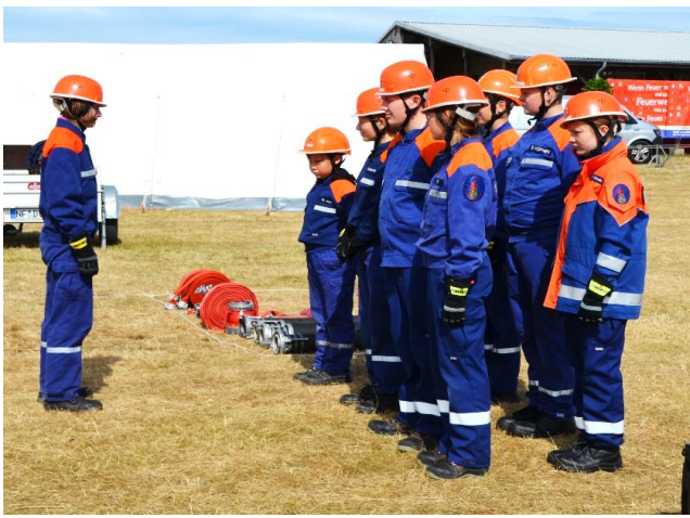
Jetzt geht`s los. Jugendfeuerwehr Jübek stillgestanden!