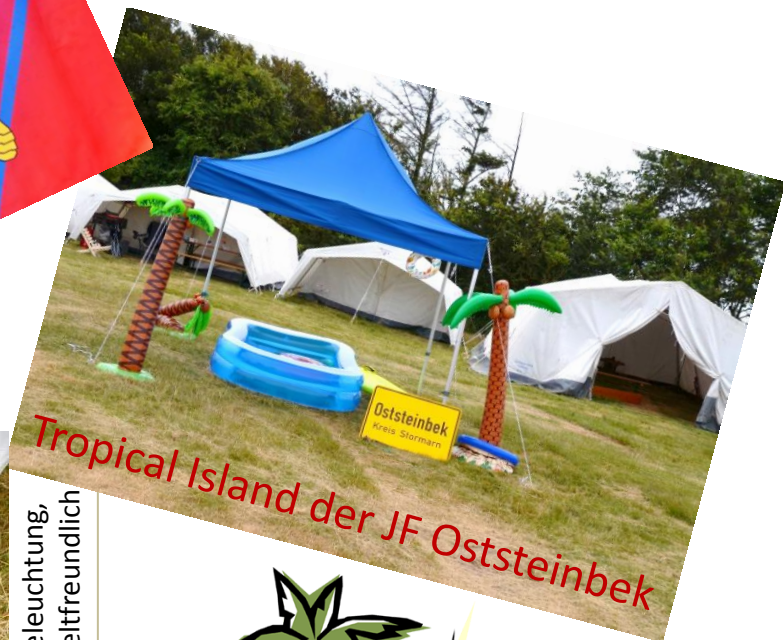
Tropical Island der JF Oststeinbek