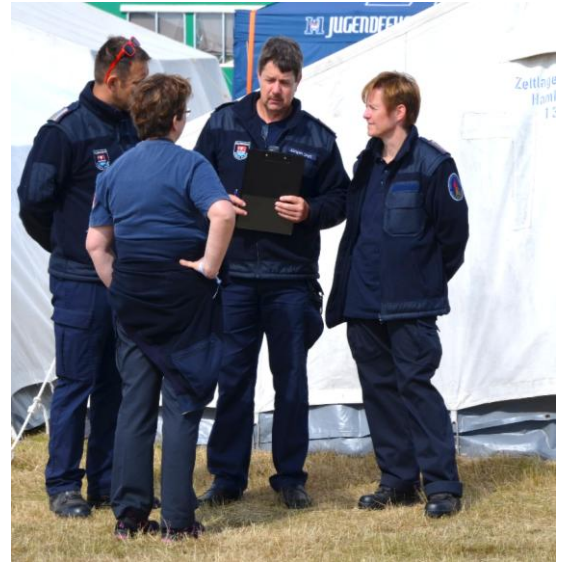
Gespräch unter den Bewertern