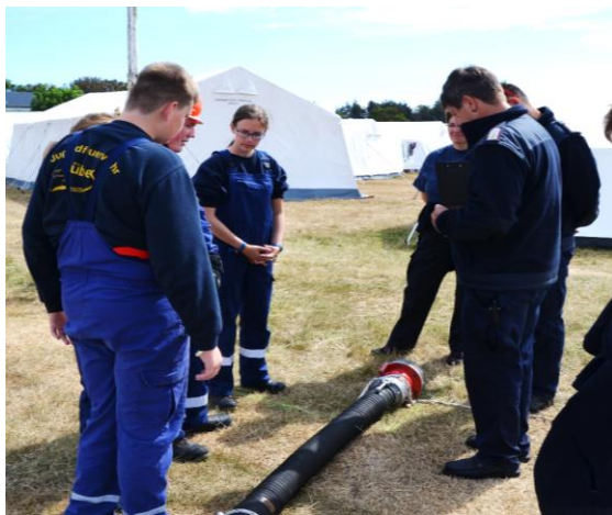
Erläuterungen für die Gruppe.