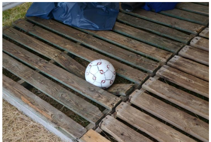
Fußball oder als Fußball getarnte Eisenkugel? Gesehen bei der JF Reinbek.

Wir danken EDEKA für diese kühlende Überraschung am Dienstag.