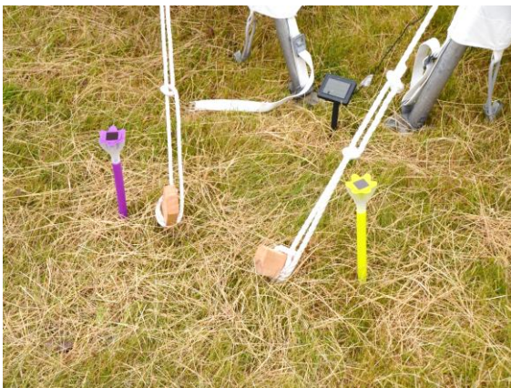
Abends mit Beleuchtung, aber sehr umweltfreundlich