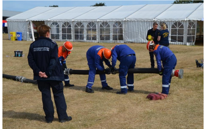
Herrichten der Wasserversorgung am „offenen Gewässer“