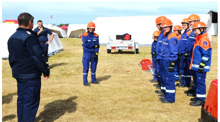
Meldung beim Abnahmeberechtigten.