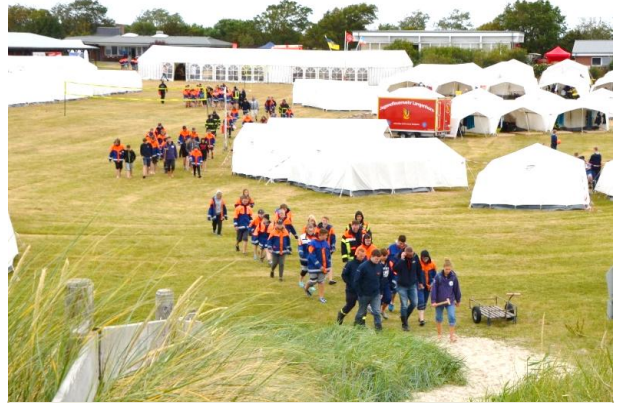
„Wir haben genug vom Lager, verschwinden und flüchten zur nächsten Hallig.“